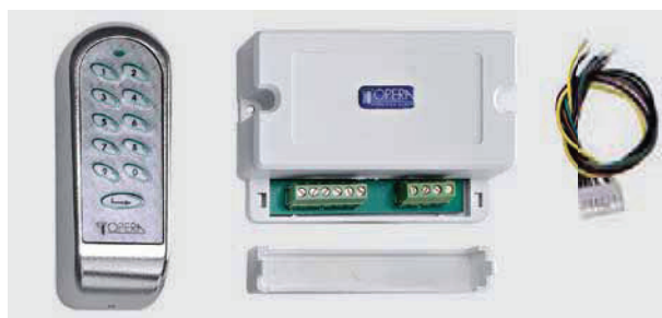
Tastiera a codice „Access“

9 Vca / 12 Vcc a 10 tasti numerici più un pulsante di Enter compresa di elettronica di gestione per 2 porte e di contatto tamper di anti-manomissione con attivazione dell'allarme e temporizzatore incorporato.