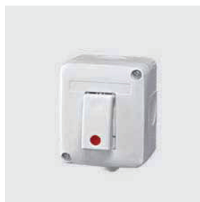
Pulsante di sblocco

Scheda elettronica con temporizzatore 1-30 sec. da abbinare a pulsante di sblocco (art. GW 20 523) per serratura SCA.