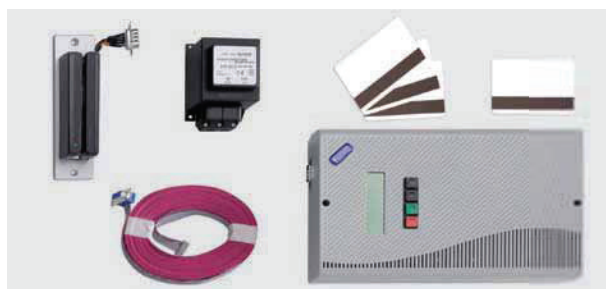
Sistema di controllo a schede

Sistema di controllo a schede 12 Vcc, con temporizzatore incorporato, compreso lettore Badge, elettronica di gestione, cavo flat, trasformatore esterno 15 Vcc, tre schede di programmazione e una scheda magnetica semplice codificata.